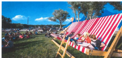
StrandstoelXXL van Studio IDM, afmeting 5,5 bij 3,5 bij 3,5 meter

2.2. Onderdeel van de ontwerpcollectie van Studio IDM is het ontwerp van de zogeheten StrandstoelXXL (hierna afgebeeld en ook wel kortweg aangeduid als 'het Ontwerp'), ontwikkeld in diverse varianten om voor bezoekers van evenementen en festivals een grote plek om te loungen of chillen te creëren.