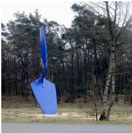
Troffel van Claes Oldenburg