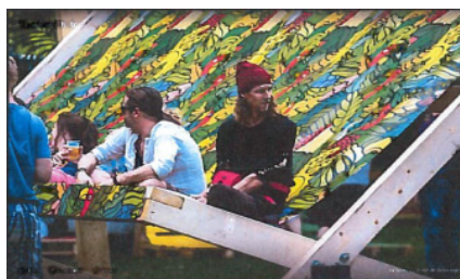
Strandstoel Reggae Rotterdam 2017

2.7. Op foto's van het Reggae Rotterdam Festival gehouden op 30 juli 2017 in het Euromastpark is de navolgende strandstoel te zien.