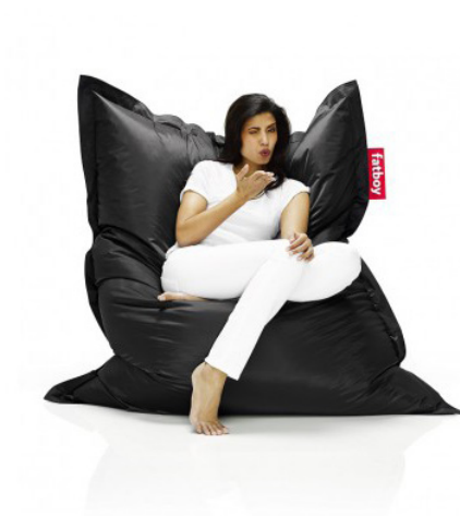
Fatboy (xxl kussen)