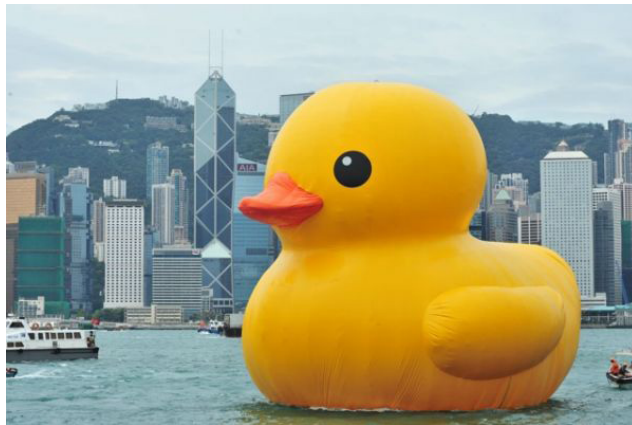
Badeend van Florentijn Hofman