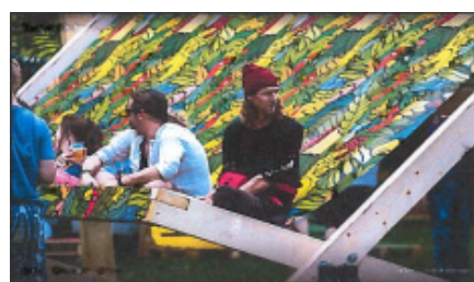
StrandstoelXXL van Studio IDM, Strandstoel festival Reggea Rotterdam 2017-2018

4.17. Je Zusje heeft ter onderbouwing van haar verweer dat geen sprake is van een inbreuk gewezen op de verschillen tussen beide ontwerpen, daaruit bestaande dat voor een zeer drukke bloemenprint is gekozen, waarmee bewust is afgeweken van een print die gebruikelijk is voor strandstoelen, en de compleet andere constructie blijkend uit het soort hout dat is gebruikt, de verwerking van het hout en de grotere bouten in en de afmetingen van de constructie. Deze verschillen maken dat nauwelijks sprake is van overeenkomsten