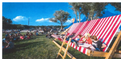
StrandstoelXXL van Studio IDM, (5,5x3,5x3,5 meter)

4.12. De kantonrechter volgt Je Zusje in zoverre dat zeker enige gelijkheid tussen deze stoelen is waar te nemen, in die zin dat ze alle geïnspireerd lijken te zijn op het archetype strandstoel en daarvan een uitvergroting zijn, de ene wat extremer dan